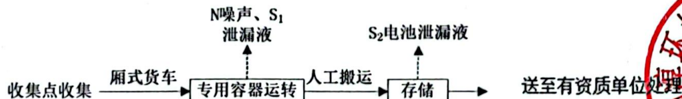
图 5-1 工艺流程图